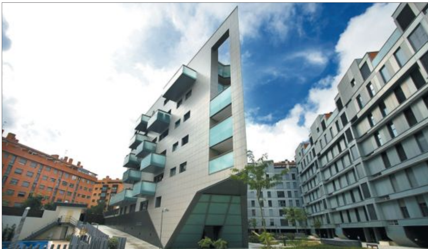
Edificio Clarión con pisos desde 295.000 euros, en Sanchinarro, promovido por Ebrosa, especializada en gama alta.