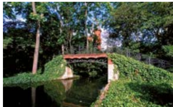
Parque de Can Solei y Ca L'Arnús (10,8 ha.)