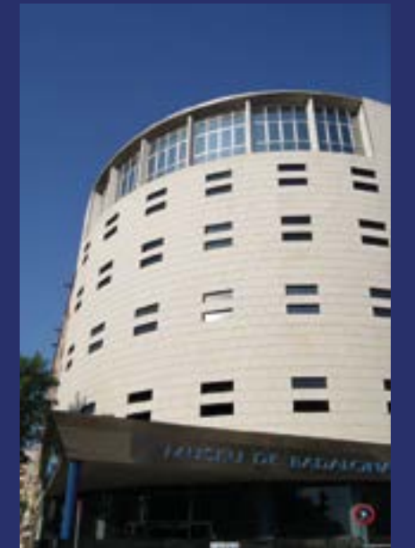
Museu de Badalona. Inaugurado en 1966. Se pueden visitar los restos de la ciudad romana en el subsuelo del edificio.