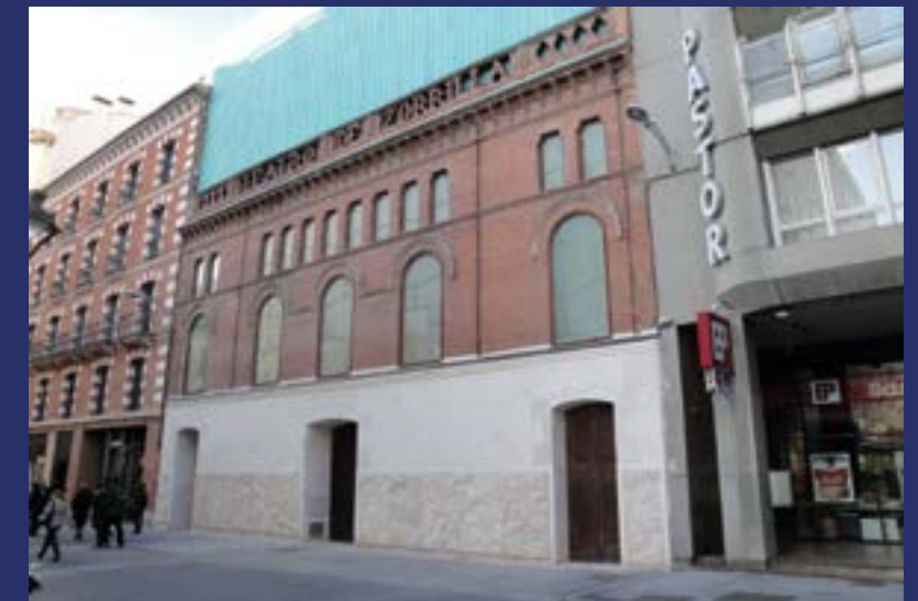
Teatro Zorrilla. Ideado por el arquitecto Jaume Botey y Garriga e inaugurado el 31 de octubre de 1868. Se construyó tomando como modelo el teatro barroco italiano.