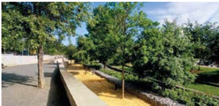
Parque de la Riera de Canyadó (2 ha.)