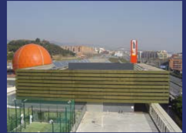
Màgic Badalona. Tiendas, restauración, cine, gimnasio y pistas de baloncesto.