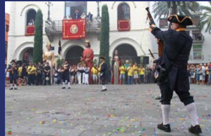
Fiestas y tradiciones en la plaza del Ayuntamiento de Badalona.