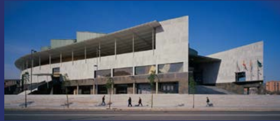
Pabellón Olímpico de Badalona.