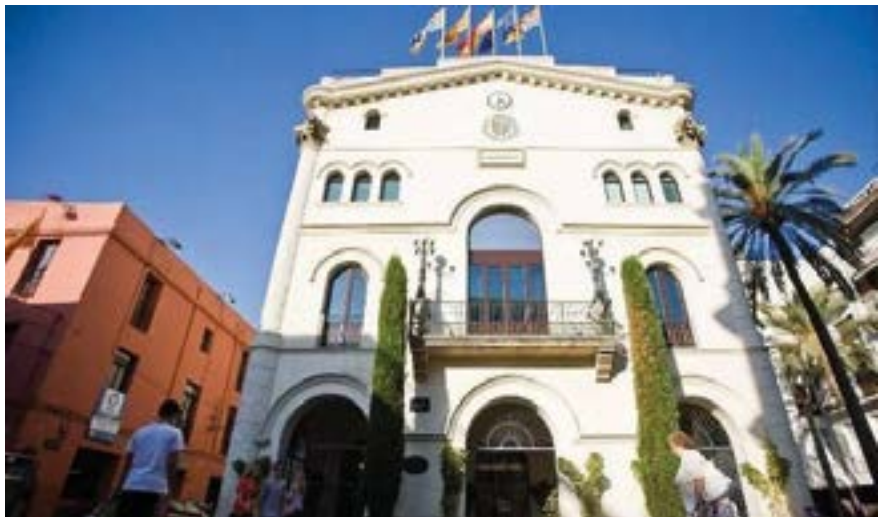
Plaza del Ayuntamiento. Casa de la Vila.