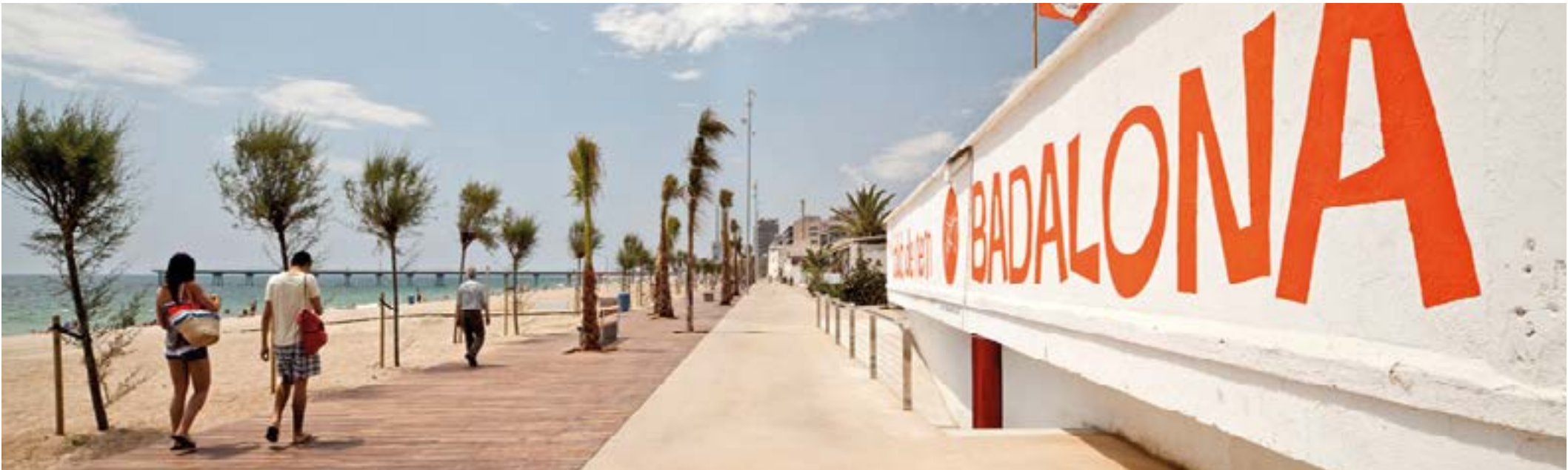
Paseo Marítimo de Badalona a 5 minutos desde la promoción.

Badalona dinámica El Edificio Balcó del Mar se encuentra situado en el barrio de la Mora Port Badalona que forma parte del Distrito V junto con Gorg, Arrabal, Congrés y Can Claris. En el barrio de La Mora destaca el Port de Badalona, el paseo marítimo de la ciudad, el Pont de Sant Lluc y la playa de la Mora. Una ciudad que se ha implicado en una transformación urbana con el objetivo de crear un nuevo modelo urbano. Una ciudad en constante dinamismo y transformación que conserva un gran patrimonio histórico-artístico, gran oferta cultural, servicios al ciudadano y el privilegio de estar rodeado de mar y montaña. Cerca de la promoción encontramos el metro Pep Ventura y Gorg, Tram Gorg, Servicio de Cercanía-Renfe y red de autobuses.