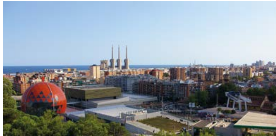
Turó d'en Caritg.