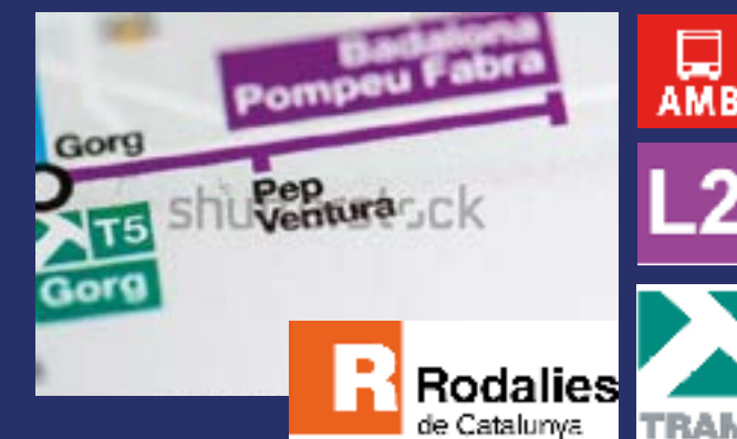
Ámplia red de transporte