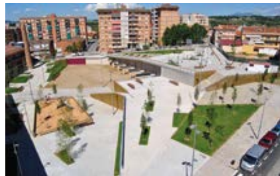
Parque de la Bòbila (3,5 ha.)